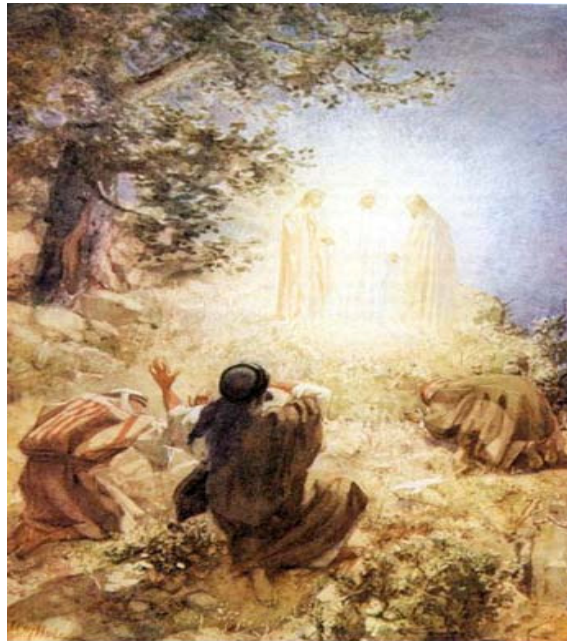
W. Hole, La Transfiguración