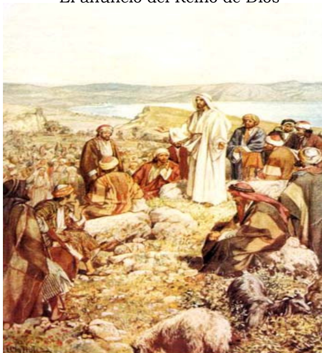
W. Hole: El Sermón de la montaña