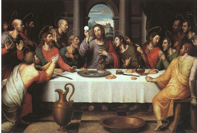
Juan de Juanes: La Última Cena

(Juan 13, 1; Lucas 22, 14-15; 21, 31-34; Mateo 26, 26-33)