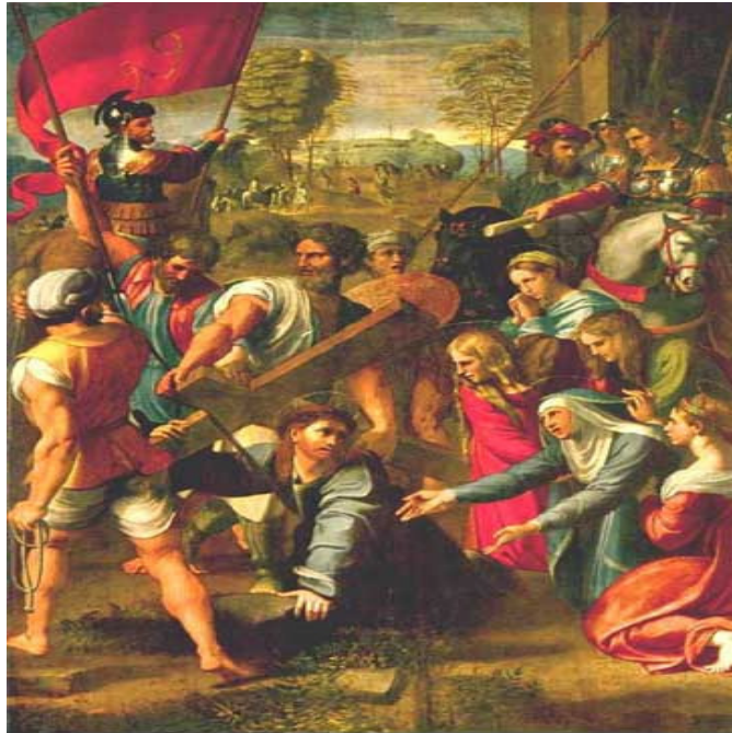
Rafael: Cristo cae camino del Calvario

(Lucas 9, 23; 23, 26-31; Juan 19, 17; Marcos 15, 21; Mateo 11, 28-30; Isaías 53,5)