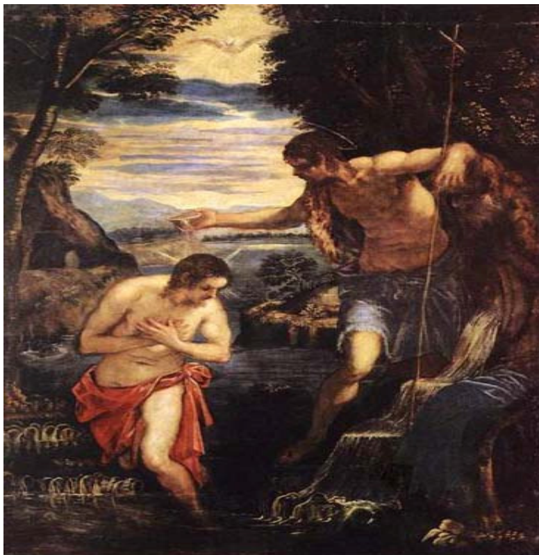
Tintoretto: El Bautismo de Jesús