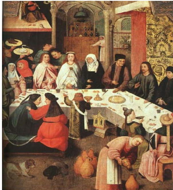
El Bosco: Las Bodas de Caná